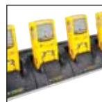
Carregador de cinco unidades

Para uma lista completa de acessórios, entre em contato com BW Technologies by Honeywell.