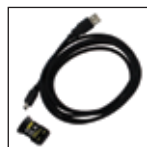
Kit de conectividade por infravermelho