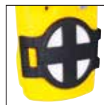
Kit de filtros auxiliar