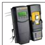
Compatível com MicroDock II