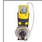
Estojo com cinto