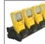
Carregador com encaixe para várias unidades