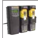
Compatível com MicroDock II