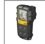
Proteção contra impacto

Para uma lista completa de acessórios, entre em contato com BW Technologies by Honeywell.